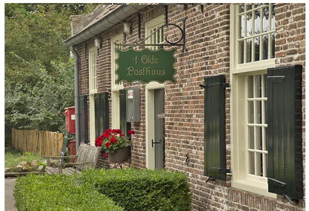
't Olde Posthuus

Strubben zijn grillig gevormd struikachtige bomen, ontstaan door het herhaaldelijk oogsten van geriefhout of door het aanvreten van de jonge uitlopers door schapen. De meerdere knoestige stammen zijn gegroeid uit een enkele strub die een doorsnede van wel twintig meter kan hebben. Het is de typische verschijningsvorm van eiken in het esdorpenlandschap. Strubbenbos lag tussen de akkers en heide. Het diende ook om het vee van de esgronden weg te houden.