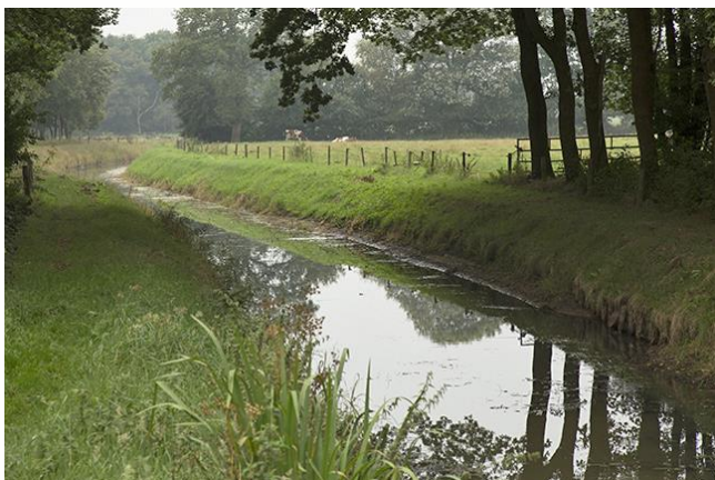
Ruiner Aa

De brede sloot waar u langs loopt is een deel van de gekanaliseerde Ruiner Aa die in het Zuidhaarsveen bij Nuil begint. De stroom voert het overtollige water van de hoger gelegen gronden van centraal-Drenthe langs Nuil en rond Ruinen af om daarna als Wold Aa naar Meppel te gaan. Daar mondt de beek uit in het Meppelderdiep dat uiteindelijk weer verbinding heeft met het IJsselmeer.