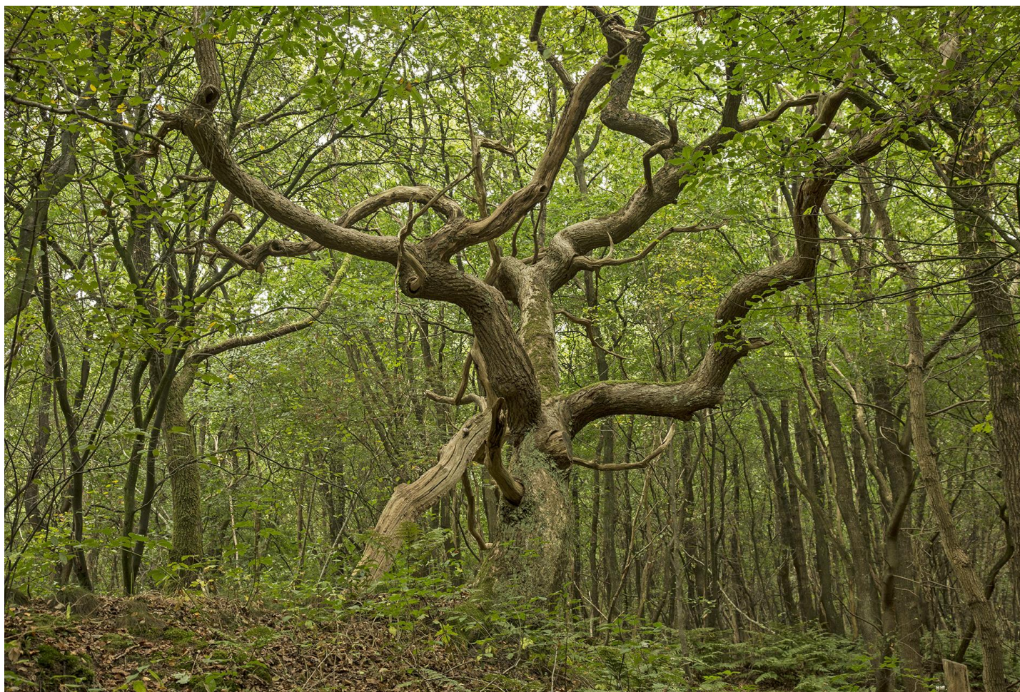
Knoestige eik bij Anholt

Dit verrassende ommetje is uitermate geschikt voor een mooie zomeravond. De wandeling begint bij de vakantiewoning 't Haantje in Anholt bij Ruinen. Al lopend krijgt u een indruk van wat Drenthe u te bieden heeft: heideveld, stroomdal, strubben, esdorp en vlakke. In drie kilometer loopt u een miniatuurtocht door de provincie. Klein, maar fijn!