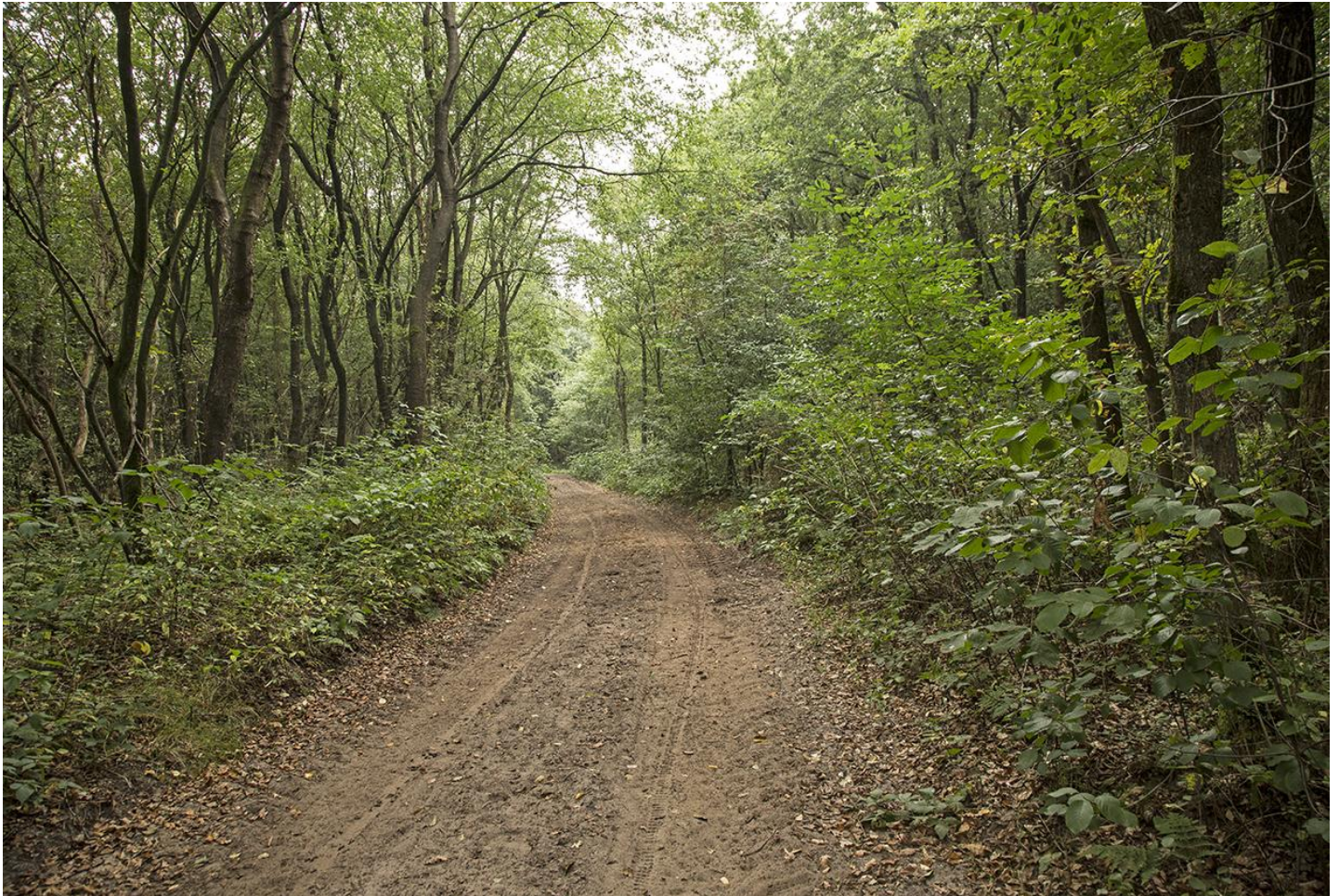
De eeuwenoude postweg bij Anholt

Een wandeling door het verleden. U loopt over een eeuwenoude postweg naar een eeuwenoude buurtschap en komt langs heide, 'veentjes' en strubbenbomen om daarna even uit te rusten waar vroeger de postkoets stil hield.