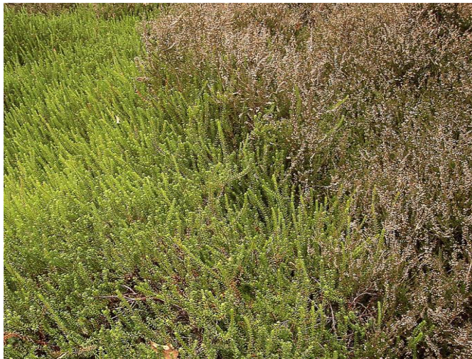
Kraaiheide links en struikheide rechts

In Drenthe komen vier heidesoorten voor: struik-, dop-, kraai- en lavendelheide. Struikheide groeit vooral op droge en voedselarme zandbodems. Dopheide is gebonden aan natte zand- en veengronden. Deze roze bloeiende soort is kenmerkend voor natte heidevelden, waarvan het Dwingelderveld de belangrijkste is. Kraaiheide met zijn intense groene kleur, maar onooglijke bloei komt vooral in ijle dennenbossen voor. Lavendelheide is gebonden aan hoogveen. In het vroege voorjaar draagt deze soort roze bolvormige bloemen.